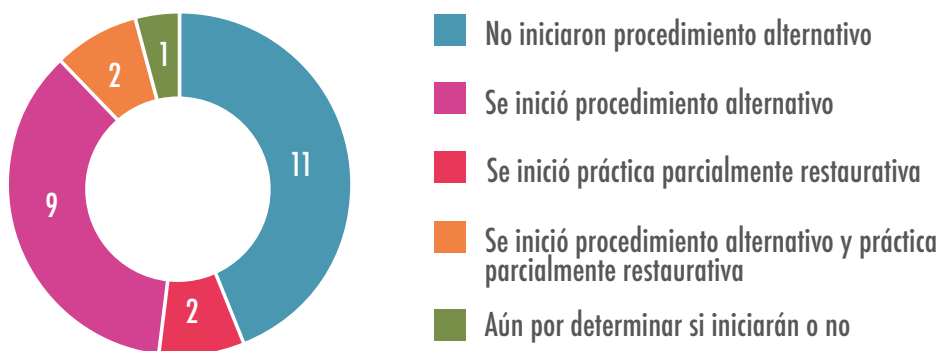
TABLA II. CASOS REFERIDOS A JUSTICIA RESTAURATIVA

En 7 de los 9 casos en los que sí se inició procedimiento alternativo las personas participantes llegaron a un acuerdo. El contenido de los acuerdos alcanzados puede resumirse de la siguiente manera: