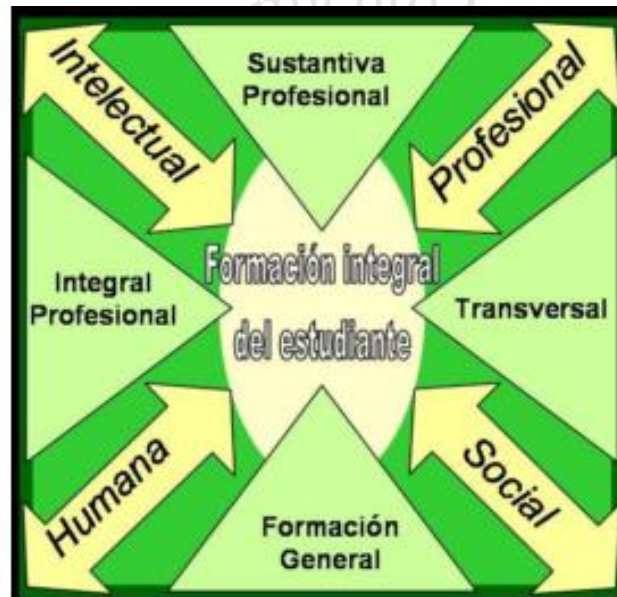
Esquema 3: Dimensiones de la formación integral y las áreas de formación en el Modelo Educativo.

La estructura curricular está organizada por cuatro áreas de formación: General, Sustantiva Profesional, Integral Profesional y Transversal; sustentada en las cuatro dimensiones de la formación integral: intelectual, profesional, humana y social; estas dimensiones guardan entre sí una relación armónica y coherente en función de los objetivos.