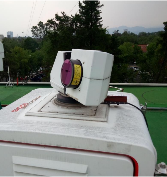
Fig. 4. Cabezal láser del perfilador de viento.