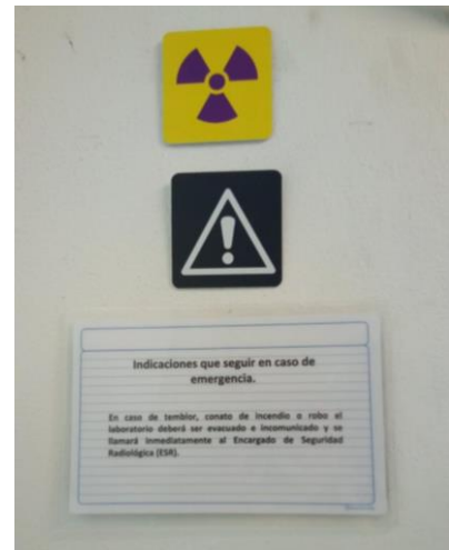
Fig. 3. Letreros de normas de uso visibles en el interior de la caseta.