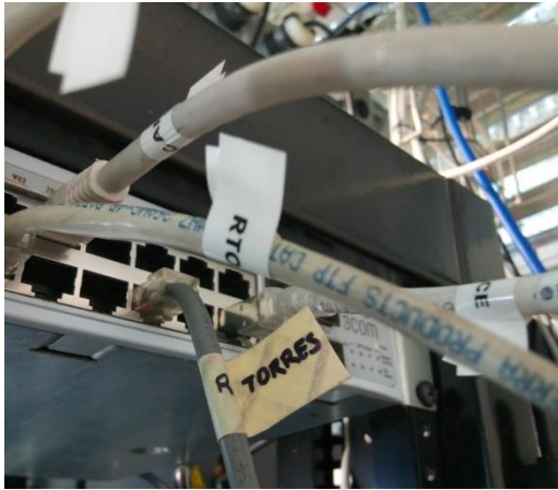
Fig. 2. Ejemplo de etiquetado de los cables pertenecientes a cada equipo en el punto de conexión a puertos de internet y tomacorrientes.