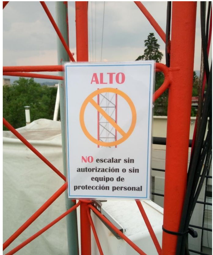
Fig. 5. Prohibición de escalar la torre arriostrada sin autorización.