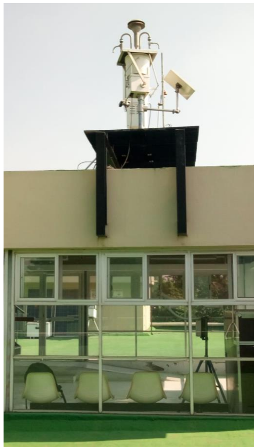
Fig. 1. Plataforma de instrumentación del ICAyCC. Arriba: caseta y techo donde se localizan los instrumentos. Abajo izquierda: Torre arriostrada. Abajo derecha: rejilla para sujeción de equipo.