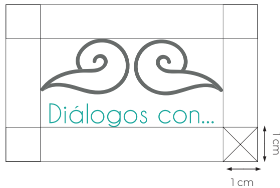
Logotipo de la colección