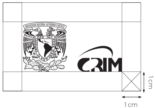
Escudo e isologo UNAM-CRIM